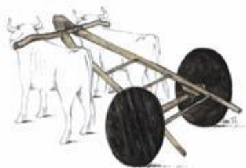
Kolo iz Ljubljanskega barja

NAJSTAREJŠE LESENO KOLO NA SVETU – Ljubljansko barje